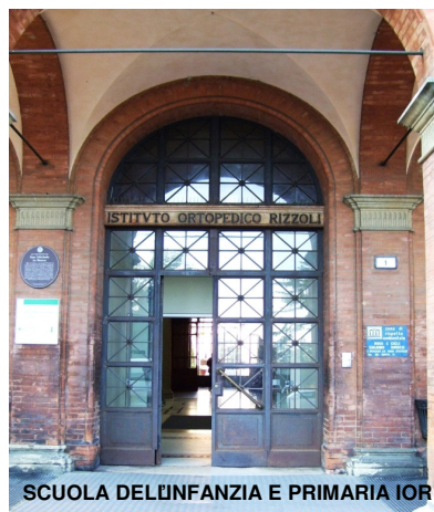
SCUOLA DELL'INFANZIA E PRIMARIA IOR

Il presente documento, adottato nella seduta del C.d.I. del 29 ottobre 2015 con Delibera n. 66