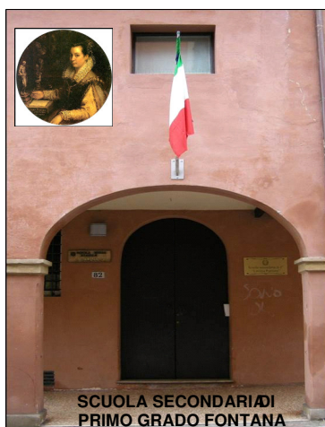
SCUOLA SECONDARIA DI PRIMO GRADO FONTANA