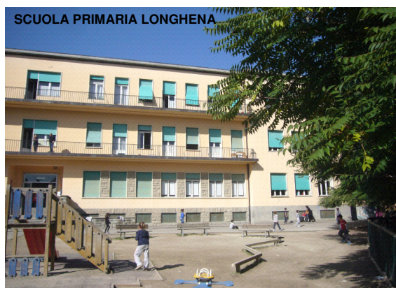
SCUOLA PRIMARIA LONGHENA