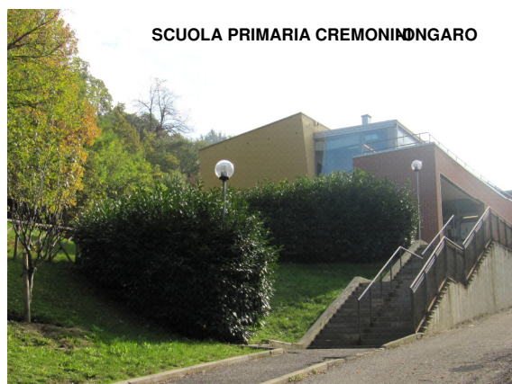
SCUOLA PRIMARIA CREMONINI-ONGARO