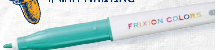
PENNARELLO FRIXION COLORS (NEW!)